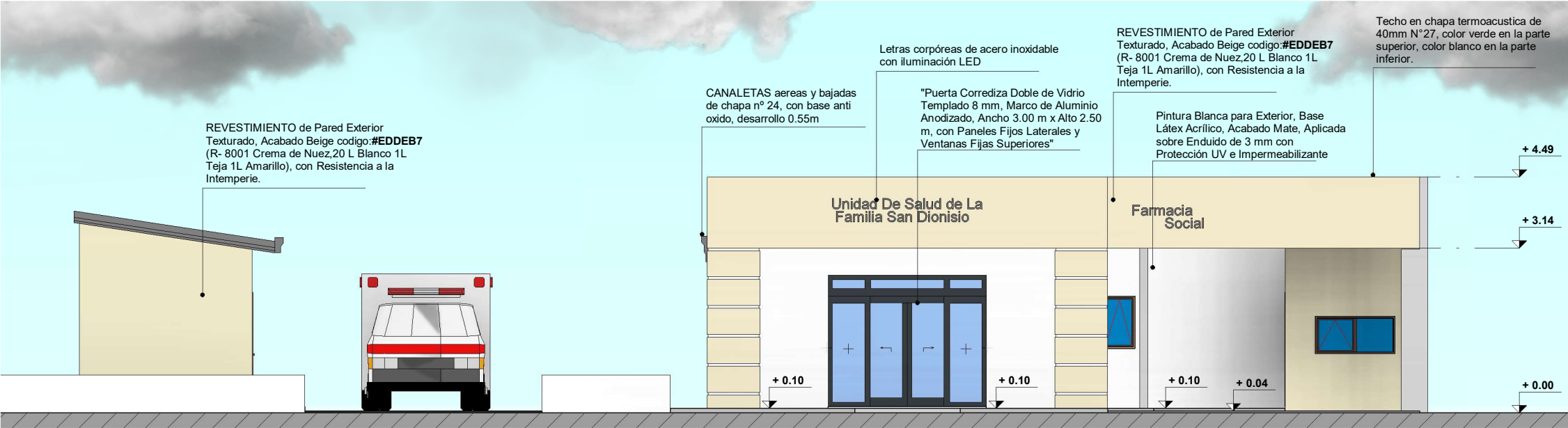
FACHADA FRONTAL ESC:1.100